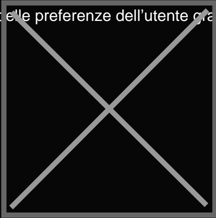
Le proposte estive di Bibo

Bibo vuole diventare il punto di riferimento cittadino per la spesa di vini, birre, superalcolici e soft drink accuratamente selezionati e di alta qualità. Sia in forma espressa - per aperitivi e cene con gli amici last-minute - sia pianificando la consegna dell’ordine e addirittura per i più appassionati, nel prossimo futuro, anche in “abbonamento”, con una selezione di prodotti diversa calibrata sulla base delle preferenze dell’utente grazie anche all’aiuto del machine learning.