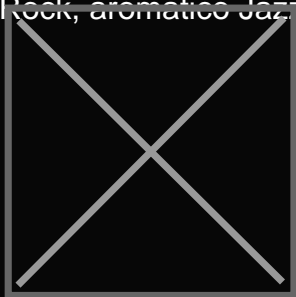
Coffee Jockey (Macchina OCS)

In occasione di Venditalia Caffè Moak lancia inoltre la linea di capsule dedicate al settore OCS e Vending compatibili con i sistemi MPS e IES: Tre pregiate miscele di caffè della linea My Music; forte Rock, aromatico Jazz, e Classic decaffeinato. Oltre a Tè al limone, caffè al ginseng, orzo e nocciolino.