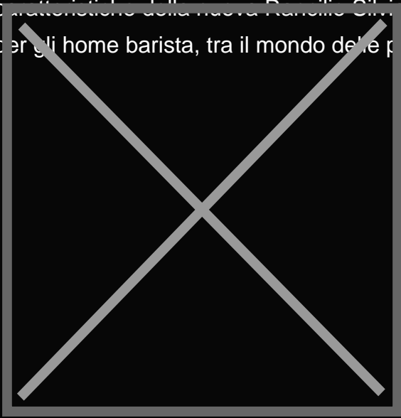
Egro Next Touch Coffee - La nuova Egro Next Touch

La stabilità termica ai vertici della categoria, il controllo totale della temperatura, la tecnologia a due caldaie indipendenti, la qualità dei materiali e la resistenza delle componenti interne, sono le caratteristiche della nuova Rancilio Silvia Pro, la macchina per caffè che definisce un nuovo scenario per gli home barista, tra il mondo delle professionali e le mura di casa.