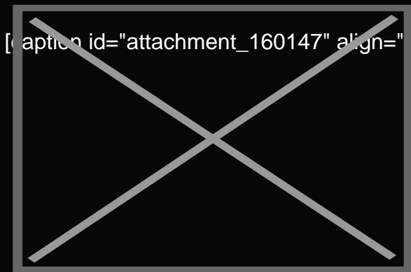
Peperone di Carmagnola[/caption]