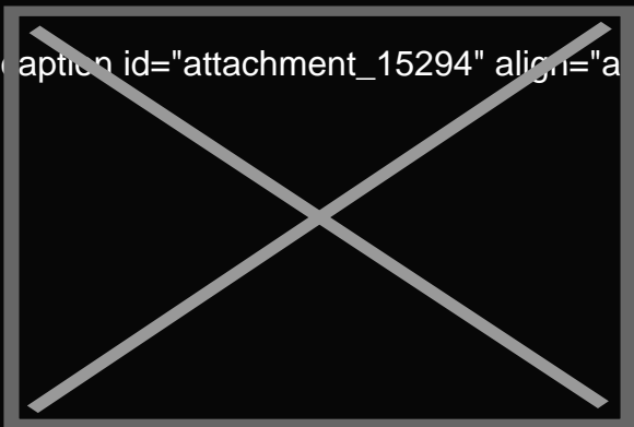
Il Motta Bar di Milano[/caption]

[caption id="attachment_15294" align="alignleft" width="300"]