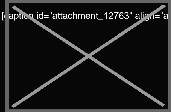
Giorgio Ghiselli, responsabile del Progetto

Agrivillage è un parco turistico dedicato ai prodotti tipici, per attrarre i flussi turistici sul territorio, ma anche per dare agli operatori dell'horeca un canale d'acquisto specializzato